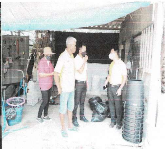
ถังหมักขยะอินทรีย์ในครัวเรือนที่เป็นชุมชนเมือง