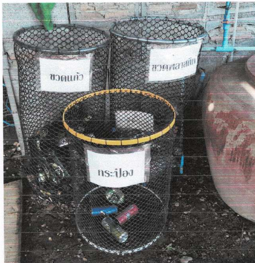
ที่คัดแยกขยะรีไซเคิลโดยใช้ตะแกรงพดลมเก่า