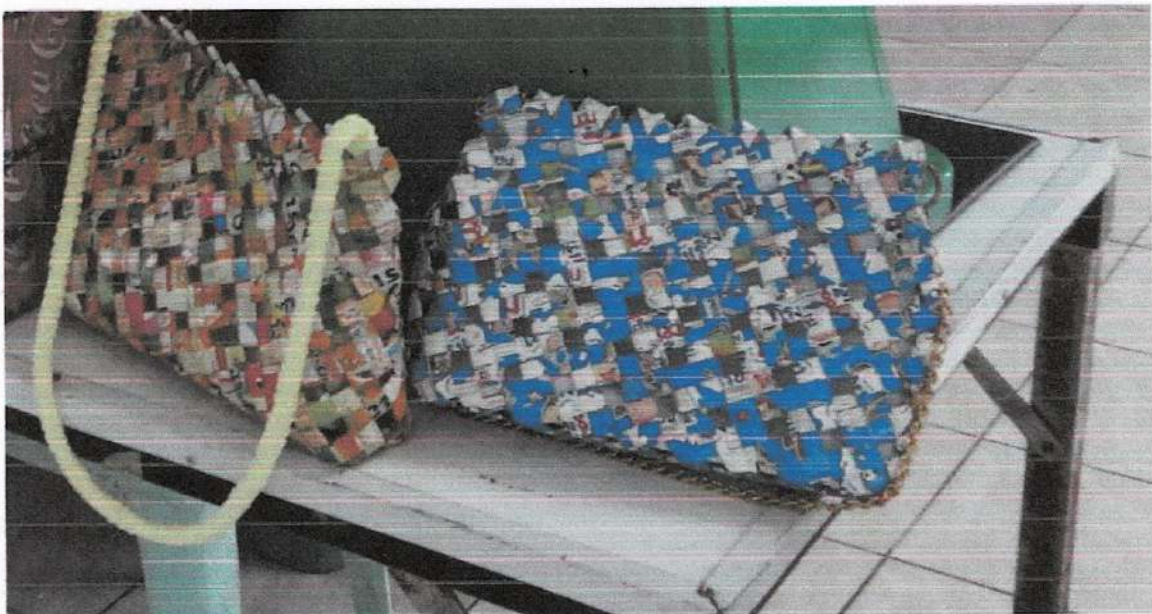
การจัดทำกระเป๋าด้วยเศษซองกาแฟ โอวัลติน หรือ กล่องนม